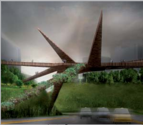
Puente Peatonal Miraflores-Barranco. Lima, Perú.