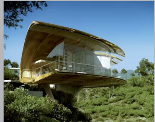
Vivienda sostenible en Bodrum, Turquía.