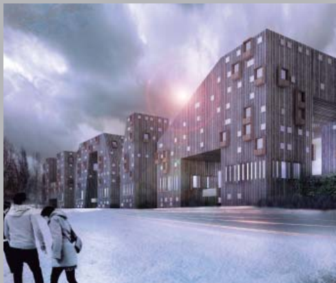
Viviendas y Masterplan en Kuopio, Finlandia.