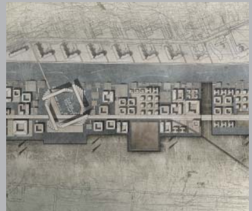
Hotel Unbalance. Lima, Perú.