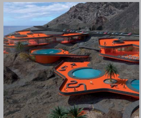
Balneario de Fuente Santa. La Palma, España.