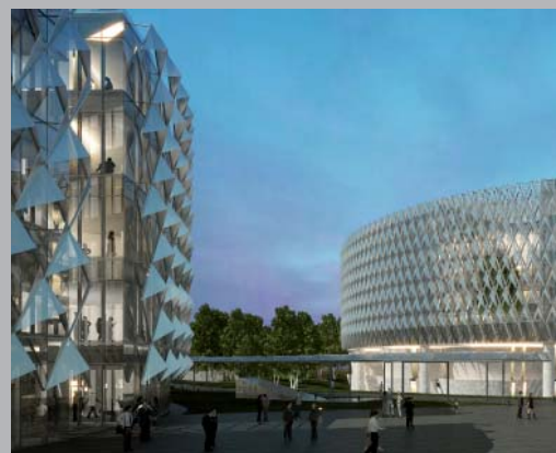
Fachadas eco-eficientes en Cdad. Justicia, Madrid.