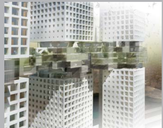
Torres de apartamentos en Dubai.