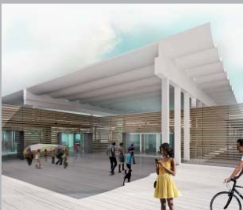
Mercado de Roquetas de Mar. Almería, España.