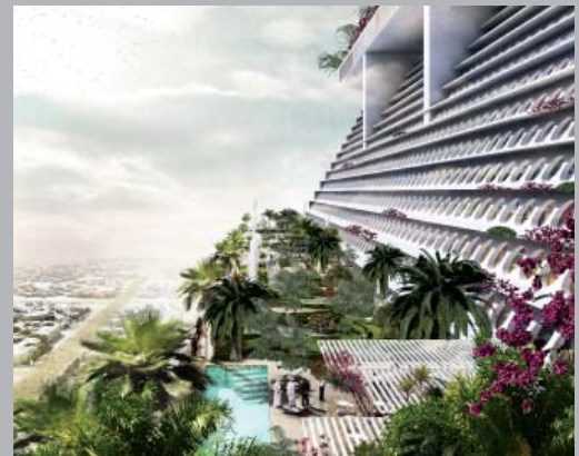
Torre icónica de uso mixto en Bawadi, Dubai.