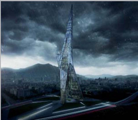
Taiwán Tower. Taichung, Taiwán.