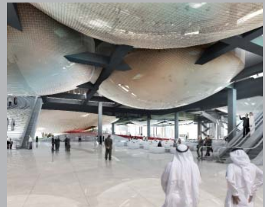
Centro de Conferencias y Hotel en Doha, Qatar.