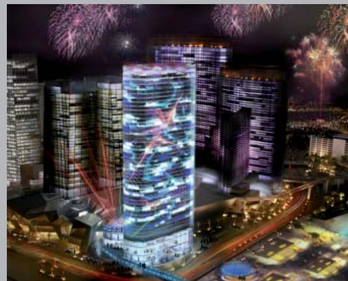
Torre de apartamentos y hotel en Las Vegas, EEUU.