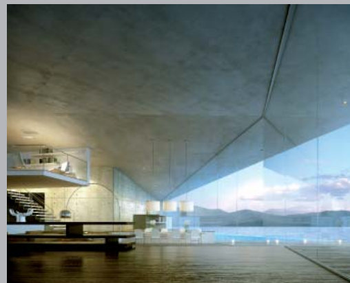
Villa sostenible en Bodrum, Turquía.