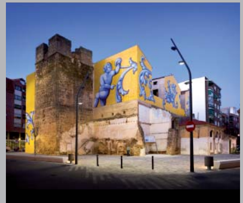
Plaza de San Miguel. Talavera, España.