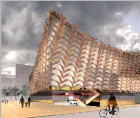
Hotel Reykjavik. Reykjavik, Islandia.