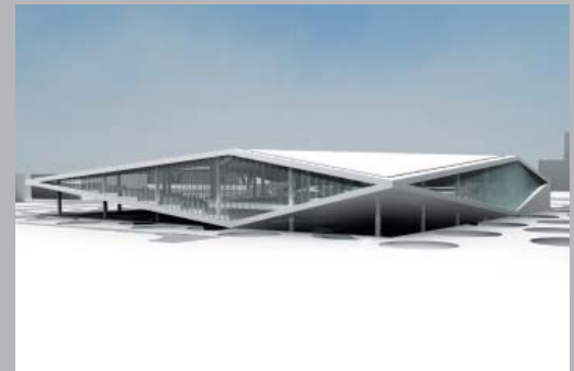
Biblioteca Central de Qatar.