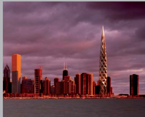
Torre residencial de 610 m en Chicago, EEUU.