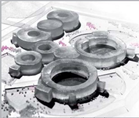
Cárcel Para Mujeres, Reykjavik, Islandia.