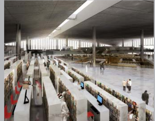
Interior de la Biblioteca.