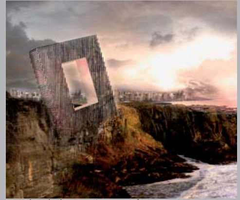
Hotel Unbalance. Lima, Perú.