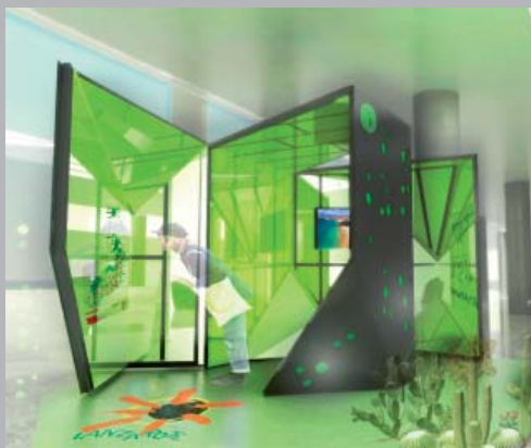
Oficina Información-Turismo. Lanzarote España.