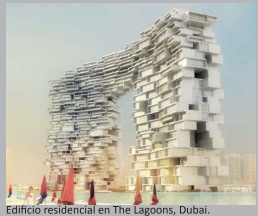
Edificio residencial en The Lagoons, Dubai.

Es una temática que seguro será muy interesante para los asistentes eminentemente jóvenes, buscando en todo momento un objetivo muy muy claro: ¡INSPIRARLES!