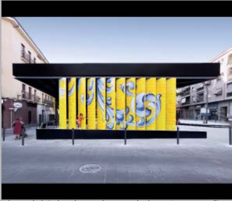
Plaza del Salvador. Talavera de la Reina, España.