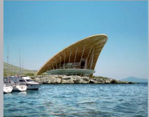
Club náutico eco-eficiente en Bodrum, Turquía.