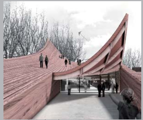
Nueva Iglesia de Valer, Noruega.